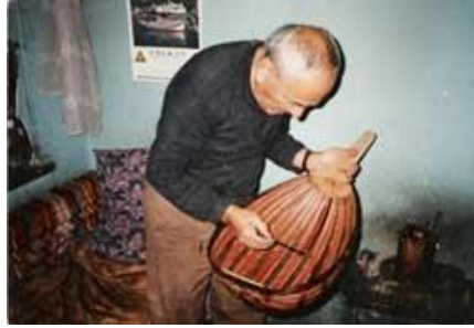
شكل رقم (١٠) صورة لصانع آلة العود

وكذلك نجح " جورج ميشيل " في تكوين شخصيته الفنية، فكان له لونه الخاص وأسلوبه المتميز في العزف على آلة العود، كما طور في أسلوب أدائه فكان يعزف الأربيجات والتآفات،