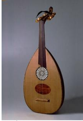
شكل رقم (٧) صورة للوجه الأمامي للعود واقفاً بشمسية واحدة