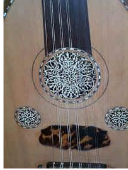
شكل رقم (٨) صورة للثلاث شماسي لآلة العود